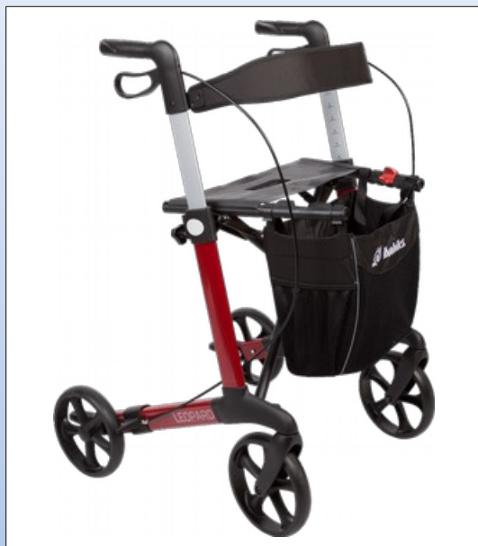
RL1a. Mobilex Rollator Leopard in rot