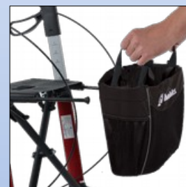
RL1d. Abnehmbare Einkaufstasche