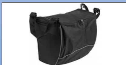
RS1d. Geschlossene Tasche