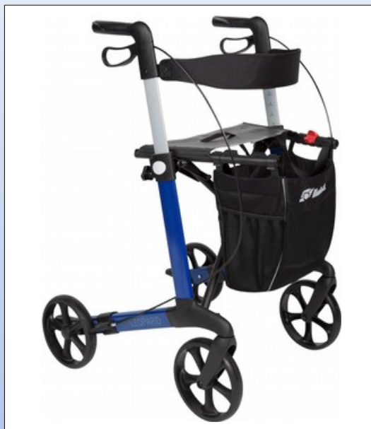
RL1g. Mobilex Rollator Leopard in blau