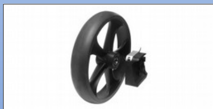
RS1e. Schleifbremse (Set mit 2 Stk.)